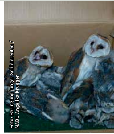
Foto: Beringung junger Schleiereulen