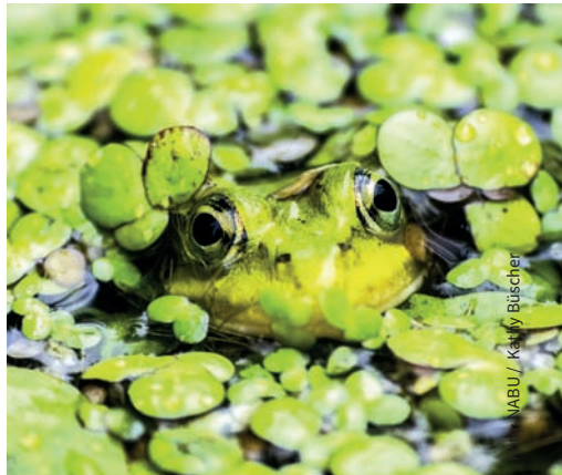
NABU / Katja Büscher